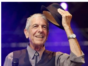
Leonard Cohen

Centraal staat Leonard Cohen. Sinds de jaren