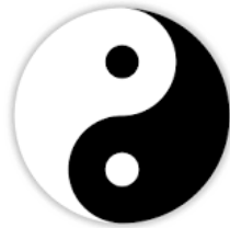
Yin Yang -Tegenstelling in balans

De zandloper heeft een torusvorm. Dit is een zelf-organiserend systeem waarin een stabiele stroom van energie gegenereerd wordt; dit wordt ook wel een attractor genoemd. Het is cyclisch en schept orde uit de chaos. Als uiting van Liefde.