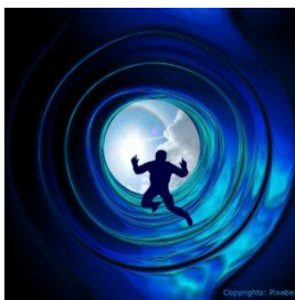
De ervaring van door een tunnel gaan

Energie kan het weefsel van de kosmos beïnvloeden en vervormen. Denk aan het beeld van een zware bal die op een trampoline ligt, de trampoline zakt door. Er ontstaat een vortex, een gat in het weefsel van de kosmos. Er ontstaat een soort trechter van energie die alle materie en licht naar binnen zuigt. Het verschijnsel van een zwart gat.