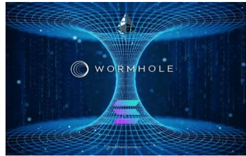
De tunnel is een weergave van een wormgat

tijdsbesef, de tijd staat stil, de afstanden zijn onmetelijk, het tijdruimte-besef is relatief. Een eindeloze, lichtgevende tunnel.